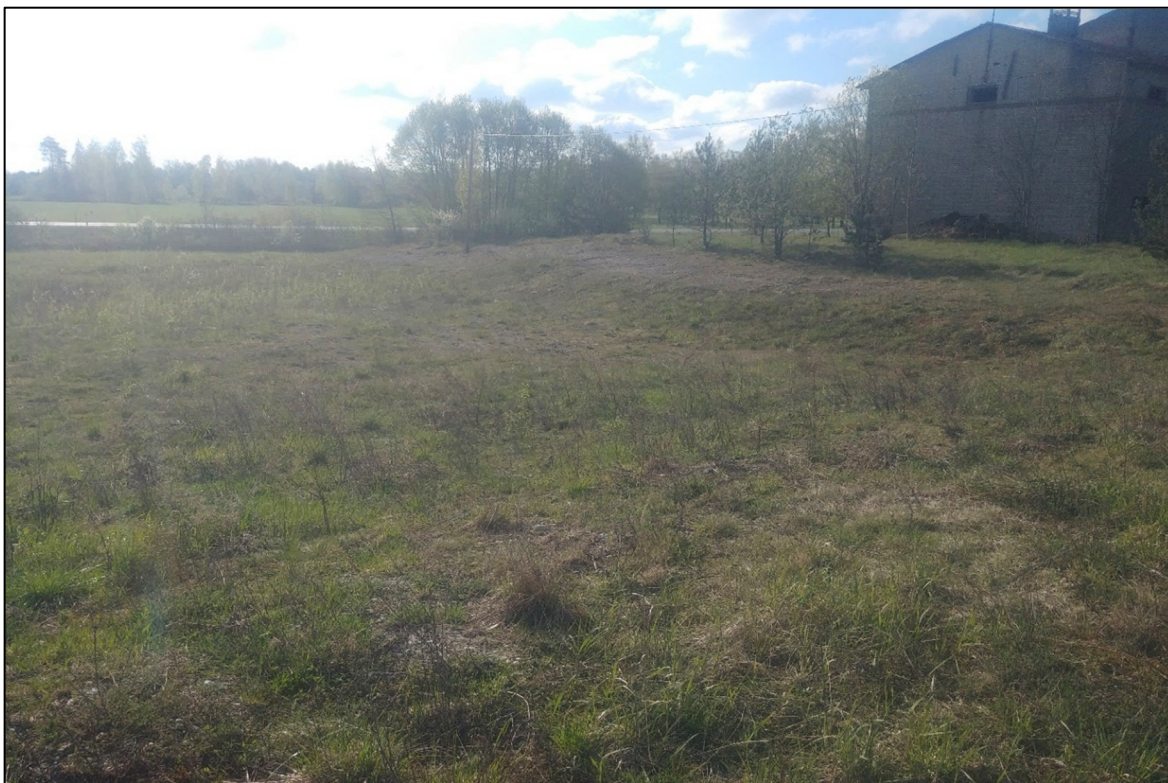
Foto 1. Vaade mäeeraldise lääneservast korrastatud karjääri lõunaosale (08.05.2024).