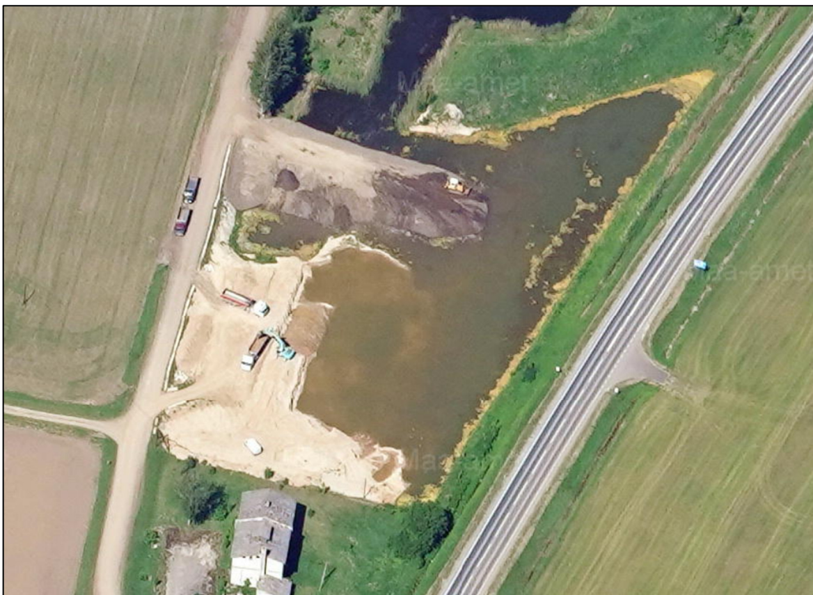
Foto 5. Maavara kaevandamine ning samaaegselt teostatav tehniline korrastamine (tagasi täitmine) Aluste kruusakarjääris (Maa-ameti kaldaerofoto 03.06.2019).