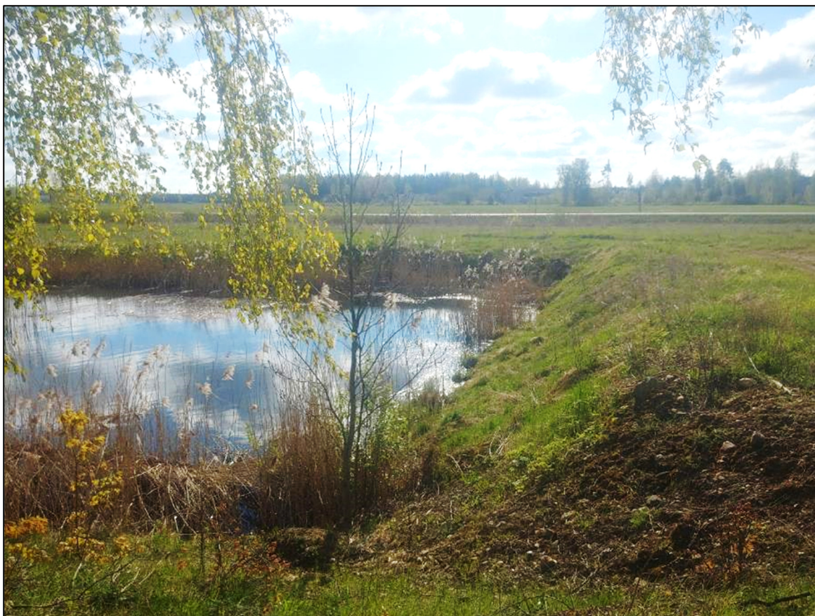
Foto 3. Vaade mäeeraldise lääneservast karjääri veekoguks korrastatud loodeosale (08.05.2024).