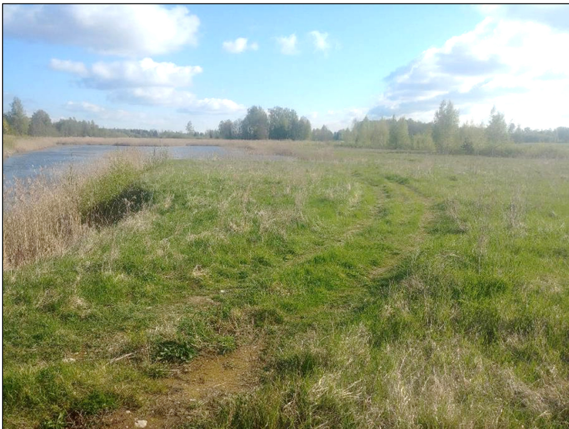
Foto 4. Vaade mäeeraldise keskosast korrastatud karjääri põhjaosale. Veekogu kaldal kulgeb kallasrada (08.05.2024).