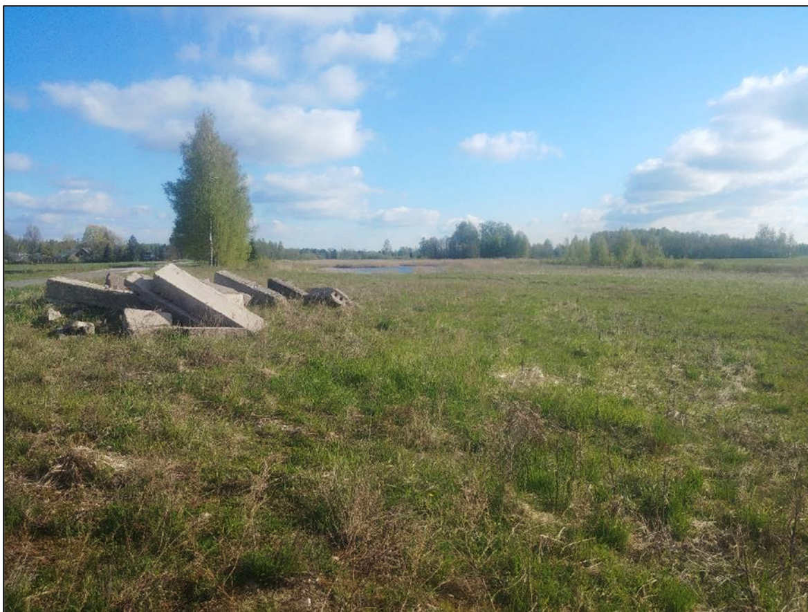
Foto 2. Vaade karjääri lääneservas asuvale betoonplakkide hunnikule, mis tuleb likvideerida (08.05.2024).